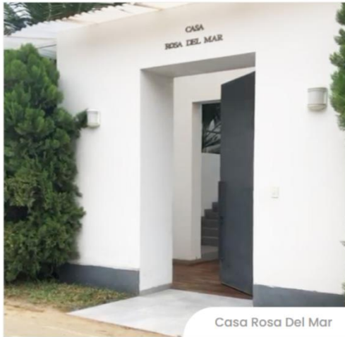
Casa Rosa Del Mar